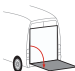
Bär VanLift Standard (S2V)