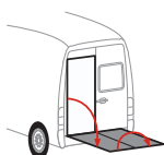
Bär VanLift FreeAccess (A2V)

Posibilidad de montaje en tracción delantera, trasera e integral.