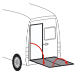
Bär VanLift FreeAccess (A2V)

Montering på versioner med for-, bag- og 4-hjulstræk / eTGE muligt.