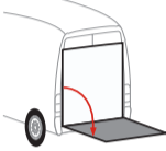
Bär VanLift Standard (S2V)