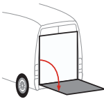
Bär VanLift Standard (S2V)