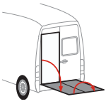
Bär VanLift FreeAccess (A2V)

Montaggio senza modifiche alla carrozzeria. Montaggio su trazione anteriore, posteriore e integrale / eCrafter possibile.