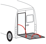
Bär VanLift FreeAccess (A2V)