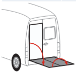
Bär VanLift FreeAccess (A2V)