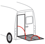
Bär VanLift FreeAccess (A2V)